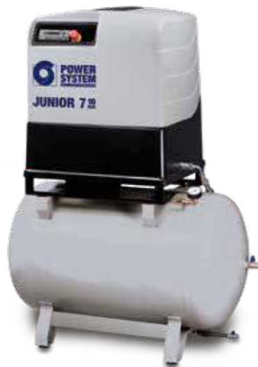
JUNIOR SD 270 litran ilmasäiliön päällä