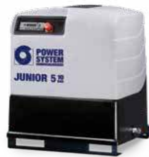
JUNIOR SD lattialle asennettava