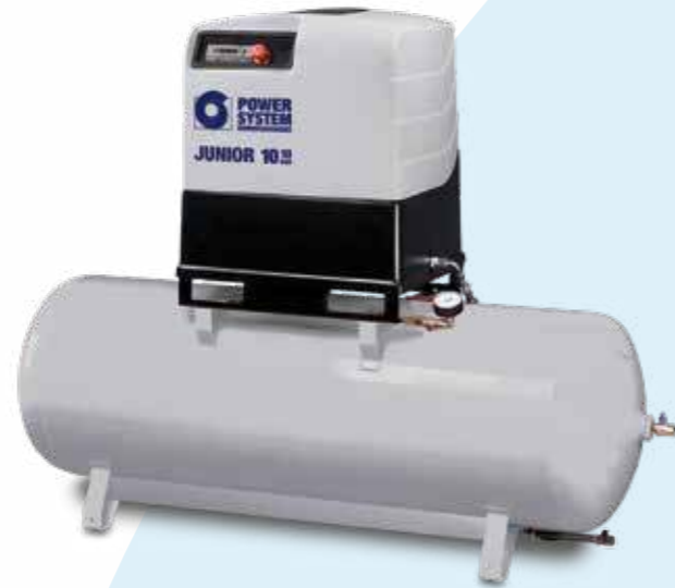
JUNIOR SD 500 litran ilmasäiliön päällä