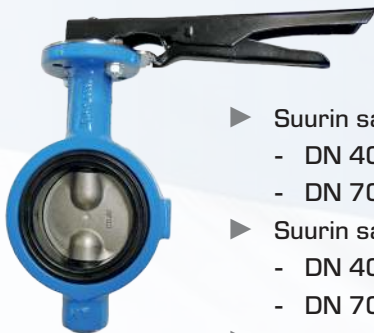
Malli SL +